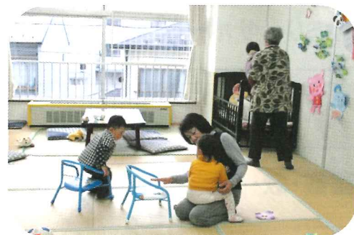
【保育ルームでのボランティア活動の様子】