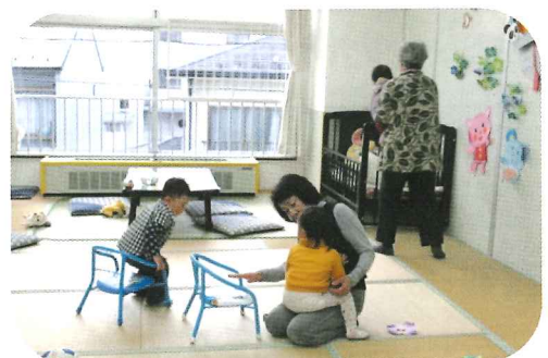
【保育ルームでのボランティア活動の様子】