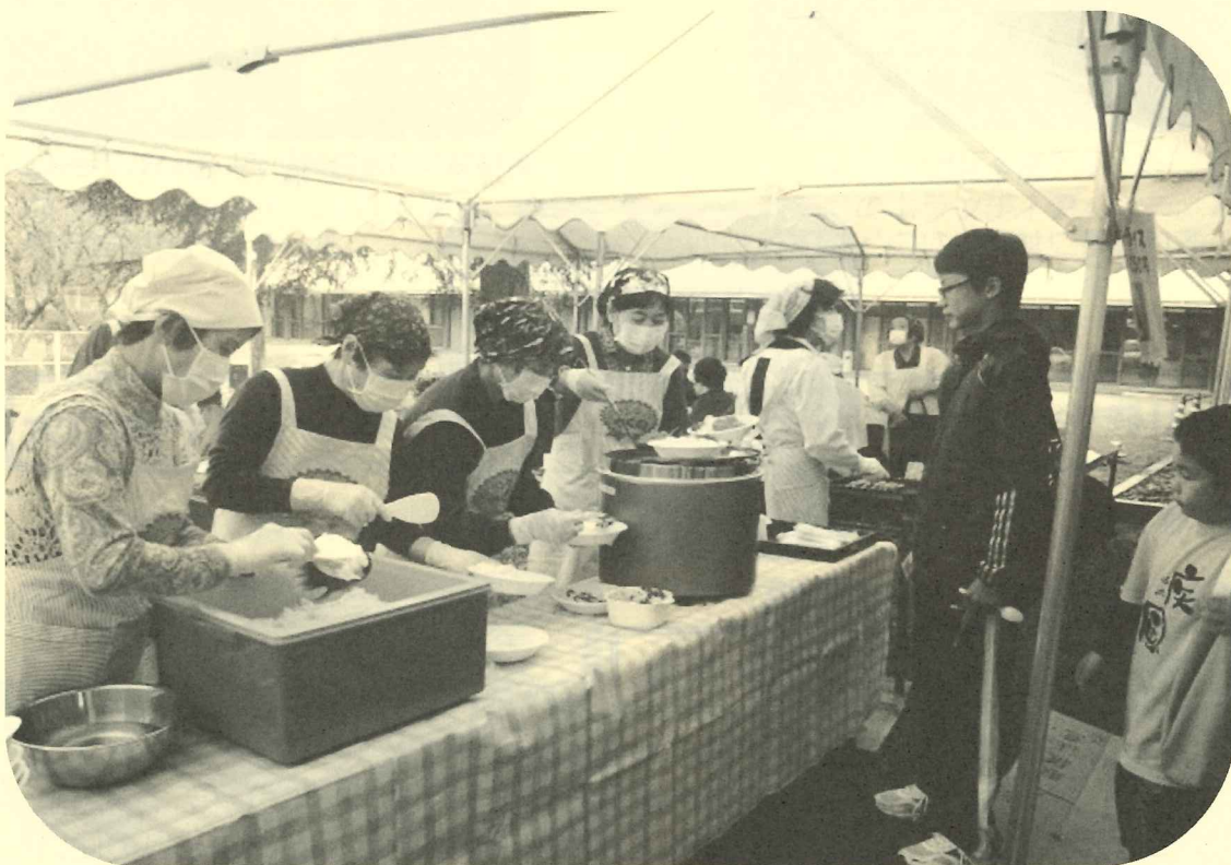
模擬店にて、並ばれた来場者に対応するボランティアさん