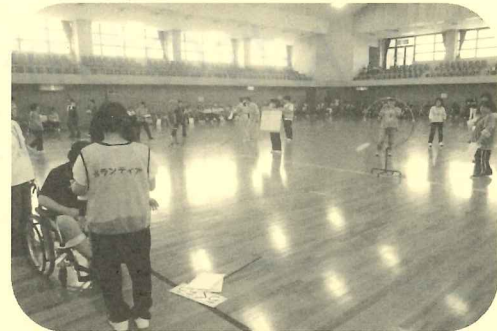
各種競技の運営補助をしていただきました