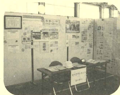
成仁子どもセーフティーネットさん展示ブース

成仁自治連絡協議会の主催で、成仁地区福祉推進協議会、成仁子どもセーフティーネットなどが協力され、地域の避難訓練に合わせて、ボランティア活動やサロン活動の展示、また、防災グッズの展示及び消防署からはAEDの使い方や身近にある物での避難用具の作り方などの講習が行われ、多くの地域の方が参加されました。