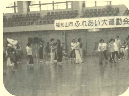
みんなで揃ってドッコイセ

ご協力いただいたボランティアさんは、競技の準備をしていただいたり、参加していただいたり、大奮闘の一日でした。