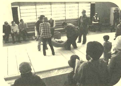
毛布を使った救助訓練の様子