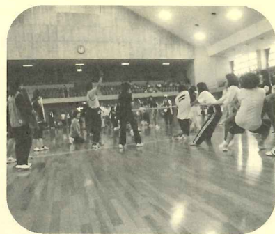
綱引き みんなの力を一つに!