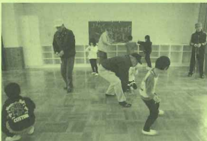
老人会との交流 昔あそび…こままわし