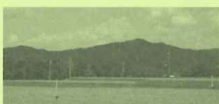
岩間からの「ふなやま」の遠望です。