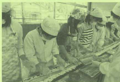
長い巻寿司づくり

み重ねが、地域住民皆様それぞれの命をつなぐための活動「生活」の支えになっていければと願うものであります。 下六人部学区の皆様方には、何かとお世話になることが多々あるかと思いますが、どうぞ福祉推進協議会の活動に対し、深いご理解ご協力を賜りますようお願い申し上げます。