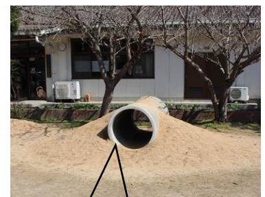
土管の端面を特別に加工