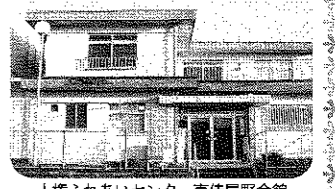
人権ふれあいセンター南佳屋野会館