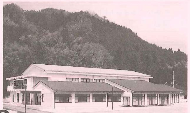
② 夜久野町ふれあいの里福祉センター(多目的広場を含む)