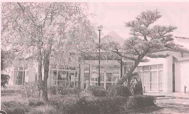
③ 大江町老人福祉センター(通称:舟越会館)