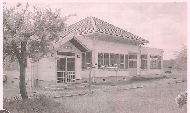
④ 大江町高齢者生産活動センター(通称:舟越工房)

市の指定管理者制度に基づき、平成22年4月1日から平成27年3月31日まで、社協が4つの施設の管理運営を行なうこととなりました。 各施設の会議室などを、どうぞご利用ください。