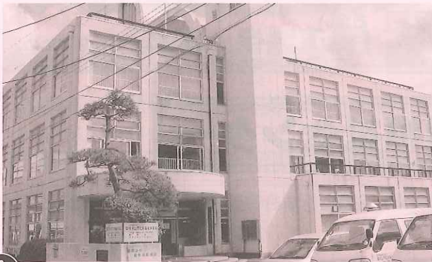
① 福知山市総合福祉会館