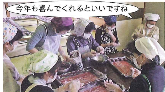
「心もち訪問」(平成23年10月15日実施)