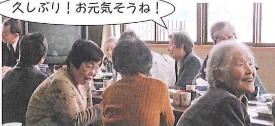
「節句のつどい」(平成24年3月3日実施)