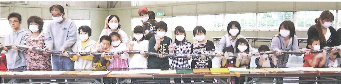
地域で初めて挑戦した、長〜い巻き寿司づくり(写真は10/30撮影:上川口推進協提供)