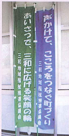
「のぼり旗作成」(今年度)

「きめ細かな福祉活動」を目標に挨拶運動を推進していくための、のぼり旗を作成されました。保育園と小中学校、各種団体へ配布され、地域福祉の取り組みを進められています。