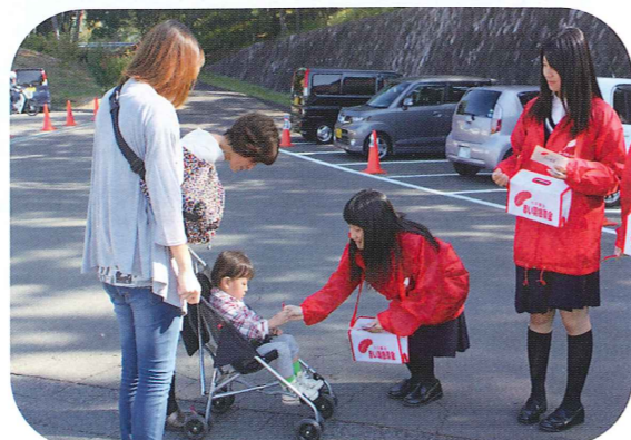
今年、新調したお揃いの赤いジャンパーを着て募金活動に取り組んでいただきました。