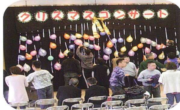
障がいのある仲間と楽しく飾り付けをしています。