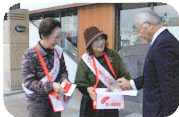
当日、28名のボランティアさんに市内7か所に分かれて募金活動をしていただきました。