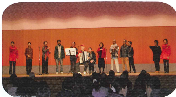
コーラスにボランティアもみなさんと一緒に手話の歌で参加しました。