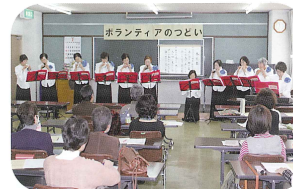
オカリナ「風の彩」グループのみなさんによる演奏で、美しい音色にあわせて一緒に歌いました。