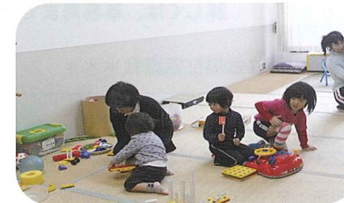
「保育ルームでのボランティア活動の様子」