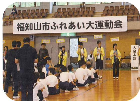
ボランティア10名が参加し、スタッフとして会場を盛り上げ大活躍でした。