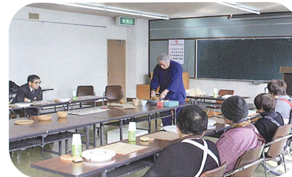
参加者のみなさんと一緒に陶芸を挑戦されました。