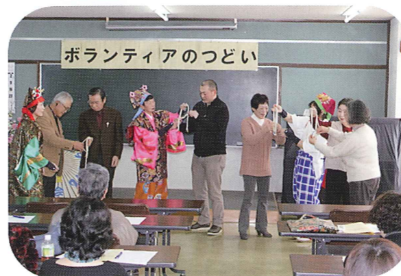
南京玉すだれ八房流福天会のみなさんが手品の他、皿回し、銭太鼓、玉すだれの4種目を披露されました。