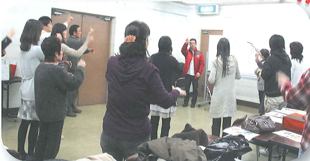
【平成24年度全国ろうあ大会（京都）大会ソングの練習の様子】

手話の学習を行う中で聴覚障がいのある方と交流し、 理解を深める活動に対して受賞されました。