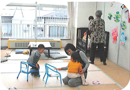
【保育ルームでのボランティア活動の様子】